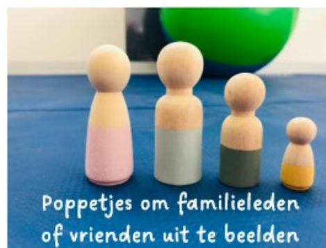
Poppetjes om familieleden of vrienden uit te beelden