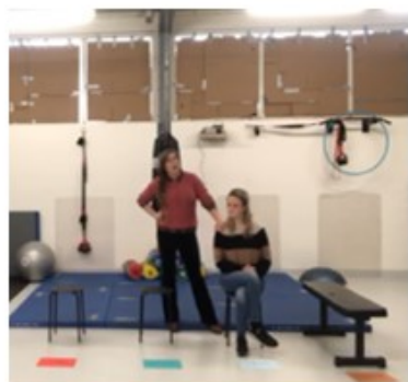
Hier spreek ik tekst in, zodat Helen kon oefenen met het uitproberen van een andere reactie.

De therapie werkt doordat de cliënt en therapeut samen in spel op zoek gaan naar nieuwe manieren van handelen. We proberen uit wat wél en niet werkt. Zo kun je bijvoorbeeld leren over je gevoel en gedrag.